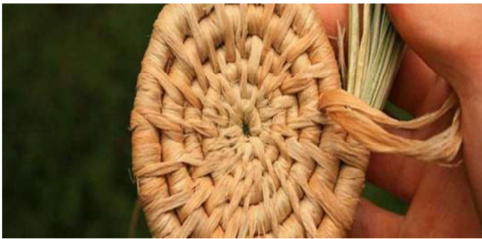
ምስል 1. የወስፌ ሥራ

የቅርጫት ሥራ ዓይነቶች ባላቸው ውቅር (pattern) እና የአሰራር ስልት የተለያዩ ናቸው። እነዚህም የወስፌ ሥራ (coiled basketry)፣ መሸመን (twined)፣ መጠቅለል (wrapped work)፣ የምንጣፍ ሥራ (matting work)፣ መጎንጎን (plaited work) እና የቀርቀሃ ሥራ (wicker work) ናቸው (Das 1979:190)። ከነዚህ መካከል የወስፌ ሥራዎች በዚህ ጥናት ትኩረት የተደረገባቸው ናቸው።