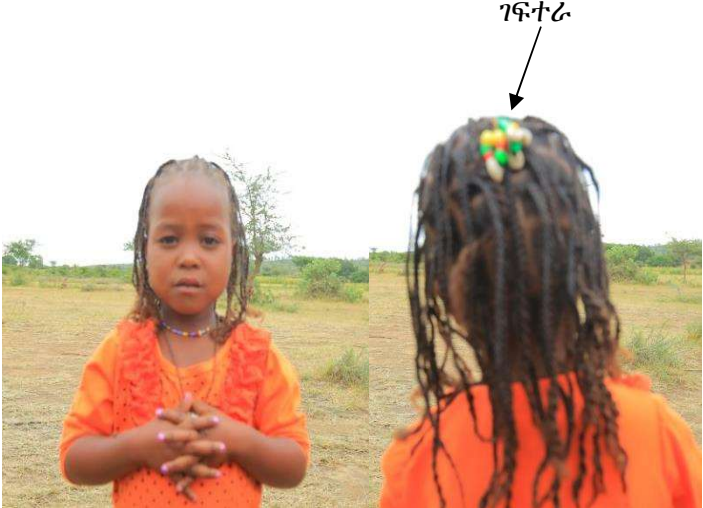
ፎቶ 2. ህፃን ጊሹ ነሞ ገፍተራ ጨሌ በአናቷ ላይ አድርጋ-ቦራ ወረዳ ዳሎታ ቀበሌ 14/ 01/ 2012 ዓ.ም።

ከድርቢ ጽሑፍ መረዳት እንደሚቻለው አገልግሎቱ ሁለት ዓይነት ነው። አንደኛው ጌጥ ነው፤ ሁለተኛው ከዋቄፊና እምነት ጋር በተያያዘ የከበረ ንዋይ - ‘ኡልፋ’ ነው። ለጌጥ የሚውለው ጌጥነቱ ለሰው ልጅ ብቻ አይደለም። የእንስቶች መጠቀሚያ የሆኑትን ልዩ ልዩ የከበሩ ንዋያት እና የቤት ዕቃዎች ለምሳሌ ጨፎ፣ አኮሌ ባህላዊ ቁሶችን ለማስገጠም የሚያገለግል በመሆኑ ጨሌ አገልግሎቱ ፈርጆ ብዙ ነው። ጨሌ የዕድሜ ደረጃ መግለጫም ነው። ልጅነትን፣ ልጃገረድነትን (ድንግልናን)፣ ያልተዳረገ መሆኑን ያመለክታል። በጸሐፊው ከተጠቀሱት የትዕምርትነት መግለጫዎች መካከል የልጅነት መለያ ምልክት የሆነው የጨሌ ዓይነት አንዱ ነው። በቱለማ ኦሮሞ ዘንድ በተለይም በገጠር አካባቢ ህፃን ለሆነች ሴት ልጅ “ገፍተራ/ Gaftaraa” የተሰኘው የጨሌ ጌጥ ከላይኛው አናቷ መሀል ለመሀል ፀጉር ላይ ይታሰርላታል፤ በአንገቷም ላይ አንድ ነጠላ/ ንጥል ጨሌ ይደረግላታል፤