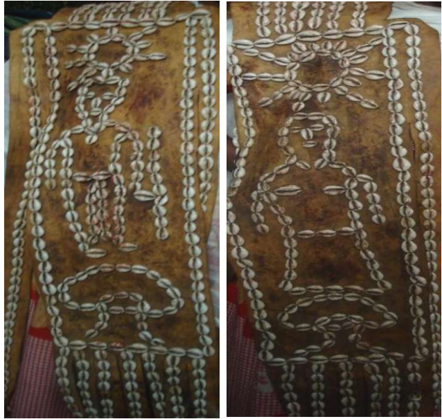
ፎቶ 1. በአያንቱ (ቃሉ) አበበ ታዬ የተሰራው ጫጩ የፊት እና የኋላ ገፅታ በሰኑት 05/02/2012 ዓ.ም

በዚህ ጫጩ አናት ላይ የምትታየው ፀሐይ ናት። ፀሐይ ለዓለም ብርሃን የምትለግስ ናት። ከፀሐይዋ በታች በእጁ ወዴቻ የያዘ የአባ ገዳ ምስል በወካይነት ይታያል። ኦዳ ደግሞ የኦሮሞ ህዝብ ትዕምርት ነው፤ ቅዱስ ዛፍ ነው። የኦሮሞ ህዝብ በገዳ ሥርዓት እና በአባ ገዳ የሚተዳደር መሆኑን ያመለክታል። ከፊትና ከጀርባ ያለው ጫጩ ርዝመት እና ስፋት፣ የተጌጠበት ዛጎል እኩል ነው። ተመጣጣኝ ነው። ከፊት አባ ገዳ እንዳለው ሁሉ፣ በእኩልነት ከጀርባ ሀደ' ሰንቁ (Haadha siinqee) አለች።