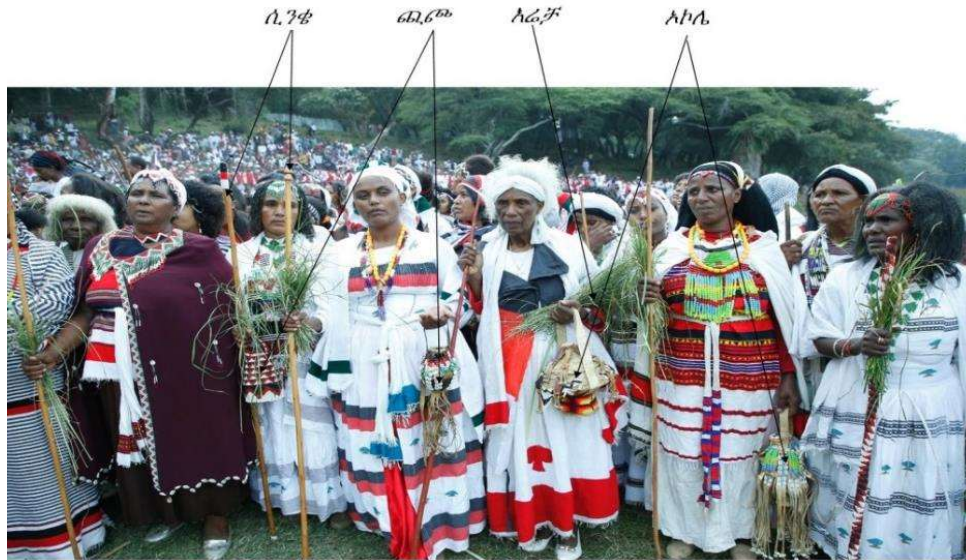
ፎቶ 7. ሀይ' ሲንቄዎች - ሲንቄ፣ አኮሌ፣ አሬቻ እና ጨጫ ይዘው በአሬቻ በዓል ላይ ቢሾፍቱ- 25/01/2012 ዓ.ም

ትችላለች። ጠቀሜታቸውም ጎልቶ የሚታየው በከበራ ወቅት ነው። ከአሬቻ ጋር የተያያዘው ተከታዩ ምስል ጥሩ ምሳሌ ነው።