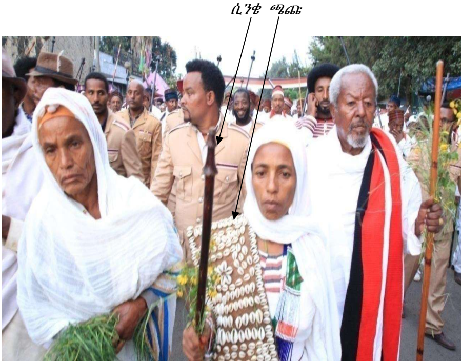
ፎቶ6. ጫጩ እና ሲንቄ የያዙ የቱለማ እንስት (ሀደ' ሲንቄ) ከባለቤታቸው (አባ ወዴቻ) ጋር ከህዝቡ ፊት ሆነው ወደ ሆራ ሀርሱዲ ሲጓዙ የሚያሳይ ቢሾፍቱ-24/01/ 2012 ዓ.ም

ሲንቄ የእንስትነት የከብር ትዕምርት፣ ሴቱ ያታን ትወክላለች። ለተባለው ዓላማ ከሰፋ ዛፍ ተቆርጦ የሚሰራው አዲስ ሲንቄ ከዛፉ ዓይነት የተነሳ ወደ ቢጫነት የሚያደላ ሲሆን፣ በጎጆ ቤት ጣሪያ ላይ ተደርጎ የምድጃ እሳት ጭስ እንዲያገኘው ይደረጋል። እየዋለ ሲያድር፣ እየቆየ ሲሄድ ወደ ቅላት እና ጥቁረት ይቀየራል። በቂቤ ወይም በስብ ተወልውሎም ውበት እንዲኖረው ይደረጋል። የቀረበውን ገለጻ የሚወክል ሲንቄ በተከታዩ ፎቶግራፍ ተመልክቷል።