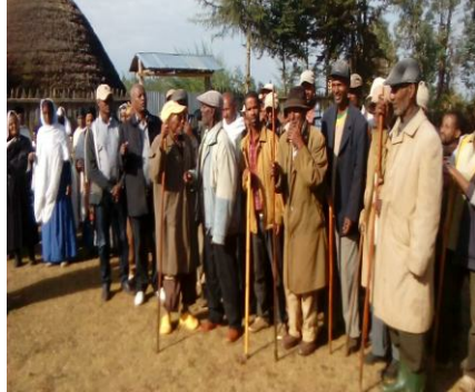
ስዕል 3. የቁም ለቅሶ፣ የካቲት 2008 (የግንድ፣ ጉመር)

ለአጋዝ ህትት ከተገጠሙ ቃል-ግጥሞች መካከል ለአብነት ያህል የሚከተሉት ቀርበዋል።