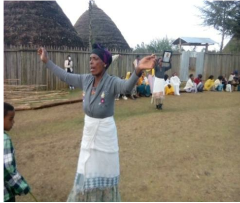
ስዕል 2. የቁም ለቅሶ (ወርኮ)፣ የካቲት 2008 (የግንድ፣ ጉመር)፣ ሴቶች

የቁም ለቅሶው ሥነ-ሥርዓት ክዋኔ በከበሮ የታጀበ ነበር። ከከበሮውን ሲመቱ የነበሩት ሴቶች ናቸው። የለቅሶ ሥርዓቱ የተከናወነው ከከበሮ የሚመቱ ሴቶችን ማዕከል ያደረገ ከብ በመስራት ነበር። ከቡ ሦስት ቀለቦች ነበሩት። የመጀመሪያው ከብ ላይ የነበሩት ወንዶች ናቸው። ወንዶች በሁለት ቡድን በመሆን ከከበሮ የሚመቱትን ሴቶች መሀል አድርገው ቆመው አጋዝ ህትትን የሚገልጹ ቃል-ግጥሞችን ዜማ ባለው ድምጽ እየተቀባበሉ ያሰሙ ነበር። ቀስ እያሉም ከቡን ሳይፈረሱና አንዱ ቡድንም ከሌላው ጋር ሳይደባለቅ ይዞሩ ነበር። የሚዞሩትም የሰዓት ቆጣሪ ከሚዞርበት አቅጣጫ በተቃራኒ ነበር። ወንዶች ሲያሰሙት የነበረው ድምጽና ሲያደርጉት የነበረው የአካል እንቅስቃሴ ከከበሮው ምት ጋር የሚናበብ ነበር።