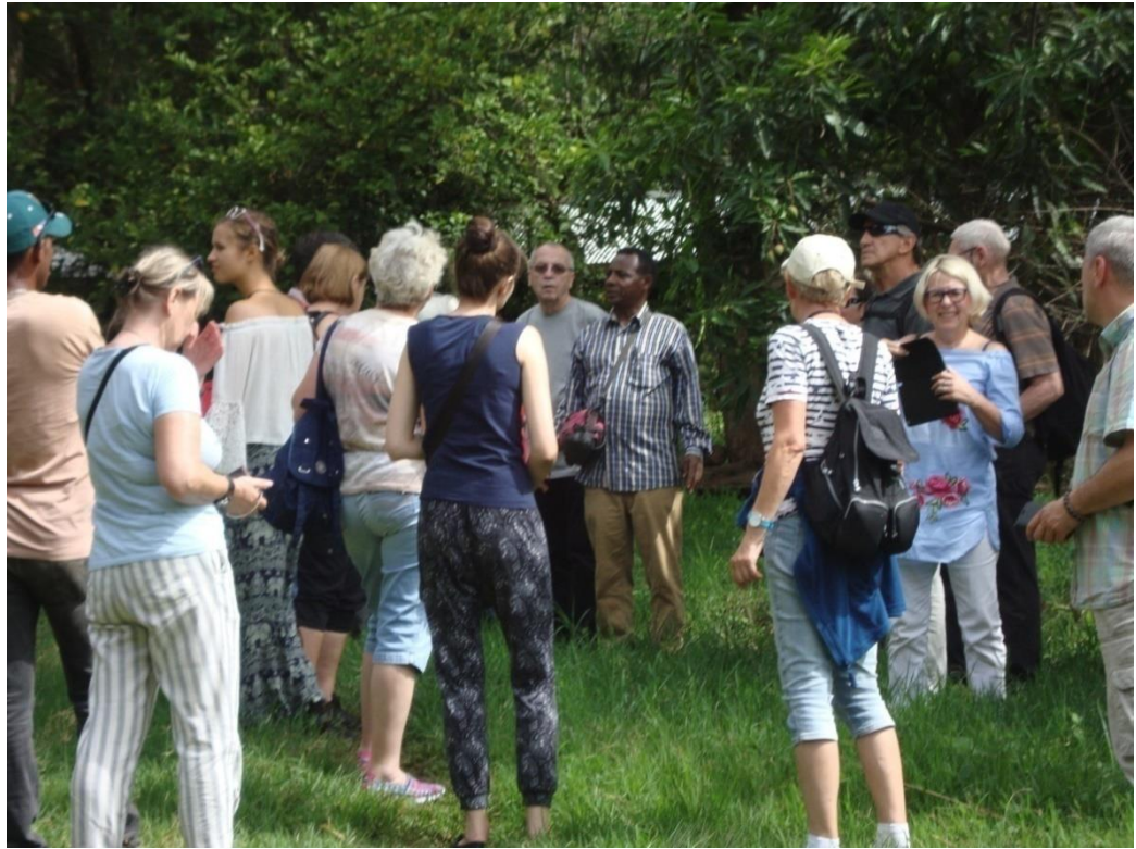
ጎብኝዎችና ኢትዮጵያዊ አስገብኝ በዑራ ኪዳነምሕረት

ገዳማቱ በውስጣቸው የተለያዩ ስእሎችና ቅርጾች፣ ንዋየ ቅድሳት ይዘዋል። የሃይማኖት፣ የባህል፣ የታሪክ ቅርሶች የያዙ ቤተ መዘክሮች መገኛዎች በመሆናቸው ይጎበኛሉ። ቅርሶችን መጠበቅ፣ መንከባከብና ለትውልድ እንዲተላለፉ ማድረግ አንዱ ተግባራቸው በመሆኑ እንደ ቤተ መዘክር ያገለግላሉ። እነዚህን መነሻ አድርገው የተሰሩና ለሽያጭ የቀረቡት ቁሶች ደግሞ በሌሎች አካባቢዎች ለሚቋቋሙ ቤተ መዘክሮች መነሻ የሚሆኑበት እድል ይኖራል።