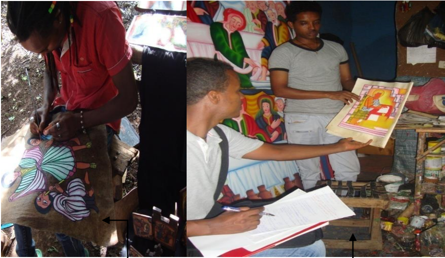
ከግራ ወደቀኝ ሰዓሊ ሳለአምላክ፣ ተመራማሪውና ሰዓሊ ዓለሙ በስራ ላይ