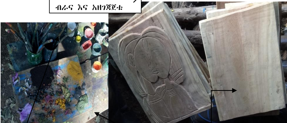
መሳያ ቡርሾች፣ የቀለም መያዣዎች፣ ለቀለም የሚሆኑ የእጽዋት ክፍሎች፣ ለቅርጻቅርጽ የተዘጋጁ ጣውላዎች