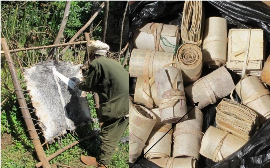
ብራና እና አዘገጃጀቱ