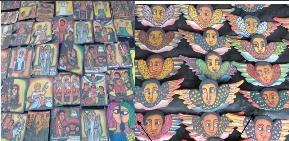
ስእሎችና ቅርጻቅርጽ ለገበያ የቀረቡበት ዐውድ