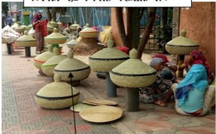
ከደንገል የተሰሩ ስፊቶች