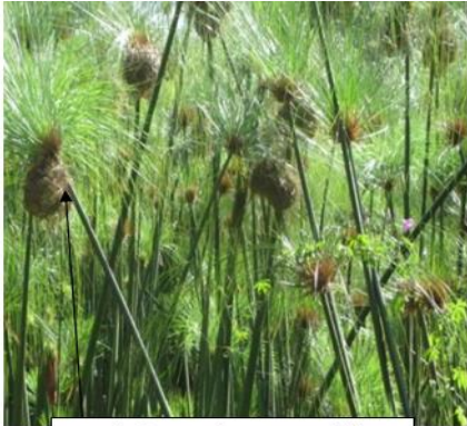
ደንገል ላይ የተሰራ የወረቤ ጎጆ