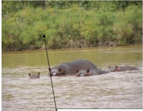
ደንገል፣ ሃይቱና ጉማራዎች