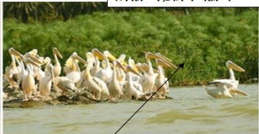
ደንገል፣ ሃይቱና ነጭ ሽላዎች